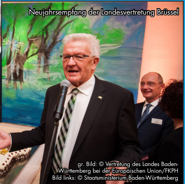
Neujahrsempfang der Landesvertretung Brüssel