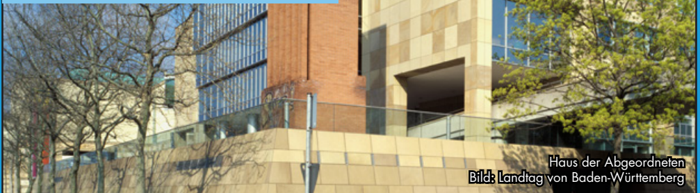
Haus der Abgeordneten

Was den meistem Steuerzahlern ebenfalls unbekannt sein dürfte: Fraktionen dürfen Mitarbeiter verbeamteten. Gerade angeblich soziale Parteien wie die SPD haben viele Fraktionsmitarbeiter verbeamtet und damit für den Steuerzahler Millionen an teuren Beamtenpensionen verursacht. Die AfD-Fraktion machte davon noch nie Gebrauch.