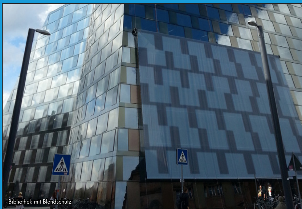
Bibliothek mit Blendschutz

Wir meinen: Das Land sollte funktionell und kostengünstig bauen und nicht Millionen für Gebäude-Experimente verschwenden. Architekturpreise sind dem Steuerzahler egal.